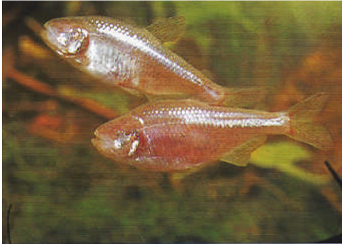
Astyanax fasciatus mexicanus

Die Tiere leben in ihren Heimatgewässern hauptsächlich von Insekten und Würmern, welche ihrerseits von den Ausscheidungen der Fledermäuse leben.